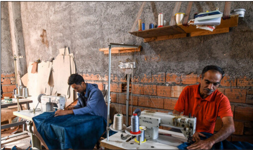
مبدأ ورود آنها از سوال است

تا قبل از پایان دولت گذشته قرار بود سه ورز شگاه ۱۵ هزار نفری که دو مورد آن در لرستان و یکی در آذربایجان شرقی است افتتاح شود اما هنوز به بهره‌برداری نرسیده و متجدد و وعده‌ای افتتاح هر سه پروژه به سال آینده موکول شده‌است. تسریع در تکمیل بیمارستان ۱۴۰ تخت‌خوابی خمین و تکمیل سه طرح ورزشی در نیمه اول سال ۱۴۰۲ شامل ورزشگاه ۱۵ هزار نفری خرم‌آباد، ۱۵ هزار نفری بروجرد و لرستان و ۱۵ هزار نفری بناب در آذربایجان شرقی است. از جمله برنامه‌های آتی سازمان مجری ساختمان‌ها و تأسیسات عمومی و دولتی است. وعده‌ی افتتاح پروژه‌های مذکور در شرایطی توسط مدیرعامل سازمان مجری ساختمان‌ها داده می‌شود که قول و قرارها از افتتاح بخشی از این طرح‌ها در سال ۱۴۰۰ حکایت داشت. اواخر سال ۱۳۹۹ ورزشگاه خرم‌آباد به پیشرفت فیزیکی ۸۳ درصد و ورزشگاه بروجرد به پیشرفت ۷۵ درصد رسیده بود و نیسان در آن زمان گفت که ورزشگاه خرم‌آباد تا پایان دولت دوازدهم افتتاح می‌شود. او به ایسنا گفت که برای تکمیل این دو پروژه به حدود ۱۲۰ میلیارد تومان اعتبار نیاز داریم که به صورت جدی پیگیری می‌شود. بنیان‌گذار دولت سیزدهم نیز در سمت خود باقی‌مانده تا زمانی گفته‌است: سازمان مجری در دولت سیزدهم تلاش کرد تا بخشی از مصوبات سفر رییس‌جمهور را در خصوص پروژه‌های خود که با تأمین منابع همراه بود تکمیل کند و تحویل بهره‌بردار بدهد